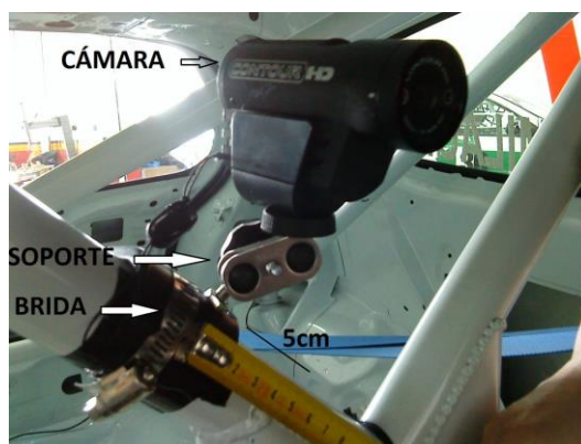
Ilustración 1: Colocación de la cámara

Será obligatorio montar cámaras para grabación de imágenes, en los Entrenamientos Oficiales y en las Carreras que componen la 51 Clio Cup Spain . Dichas cámaras deberán marcar la fecha y hora y se colocarán en la cruz central de las barras del vehículo tal como muestra la Ilustración 1 .