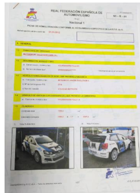
Ficha Homologación RFEdeA RFEdeA Homologation Form