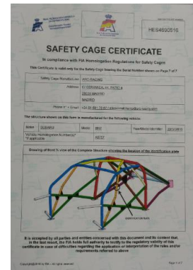
Certificado Estructura Seguridad Safety Cage Certificate

Las fichas de homologación RFEdeA son documentos descriptivos, realizados por el fabricante del vehículo o por un particular que ha realizado la preparación del vehículo, donde se recogen una serie de características técnicas y componentes del vehículo de producción en serie. Además, se completan con las extensiones para competición que definen, por tanto, el vehículo al completo.