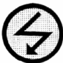
PREAVISO PUNTO DE RADIO