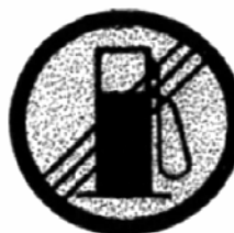
FIN DE ZONA