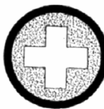
PUNTO DE SEGURIDAD