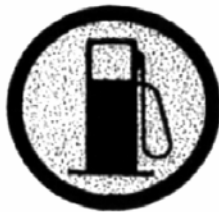
PRINCIPIO DE ZONA