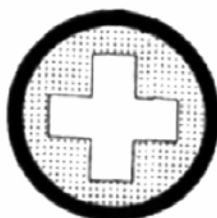
PREAVISO PUNTO DE SEGURIDAD-