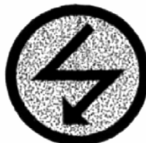
PUNTO DE RADIO